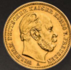
20 Mark Wilhelm I

Feingewicht: 7,1685 g Feinheit: 900,0 Ø x Dicke: 22,5 x 1,4 mm