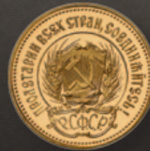
10 Rubel Tscherwonetz Feingewicht: 7,74 g Feinheit: 900,0 Ø x Dicke: 22,7 x 1,4 mm