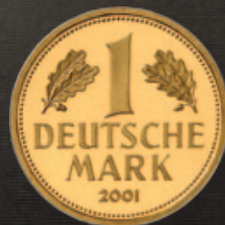
1 DM Gold 2001

Feingewicht: 7,1685 g Feinheit: 900,0 Ø x Dicke: 22,5 x 1,4 mm