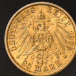
20 Mark Wilhelm II

Feingewicht: 7,1685 g Feinheit: 900,0 Ø x Dicke: 22,5 x 1,4 mm