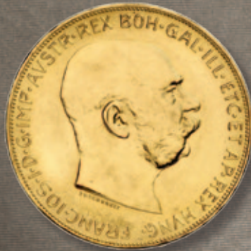
100 Ö Kronen Feingewicht: 30,4878 g Feinheit: 900,0 Ø x Dicke: 37,0 x 2,15 mm