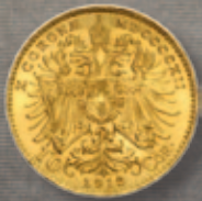
10 Ö Kronen Feingewicht: 3,0488 g Feinheit: 900,0 Ø x Dicke: 19,0 x 0,82 mm