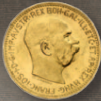
20 Ö Kronen Feingewicht: 6,0976 g Feinheit: 900,0 Ø x Dicke: 21,1 x 1,35 mm